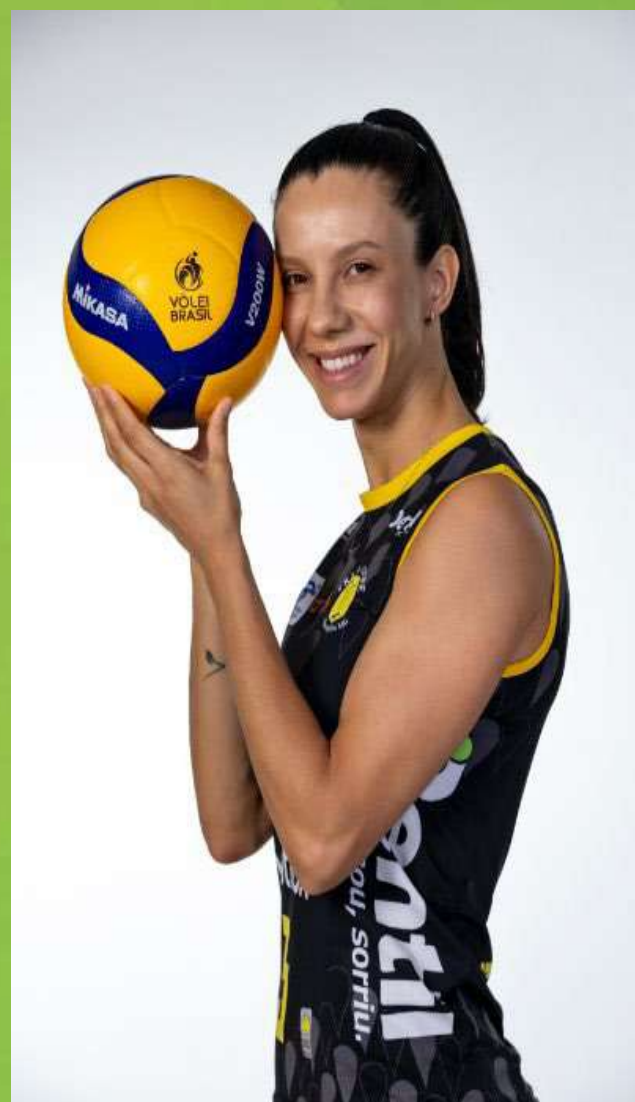
Macris Carneiro Medallista Olímpica de Vóley